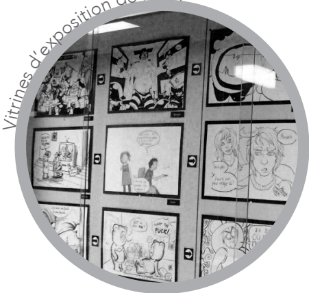
Vitrines d'exposition de l'ÉMI