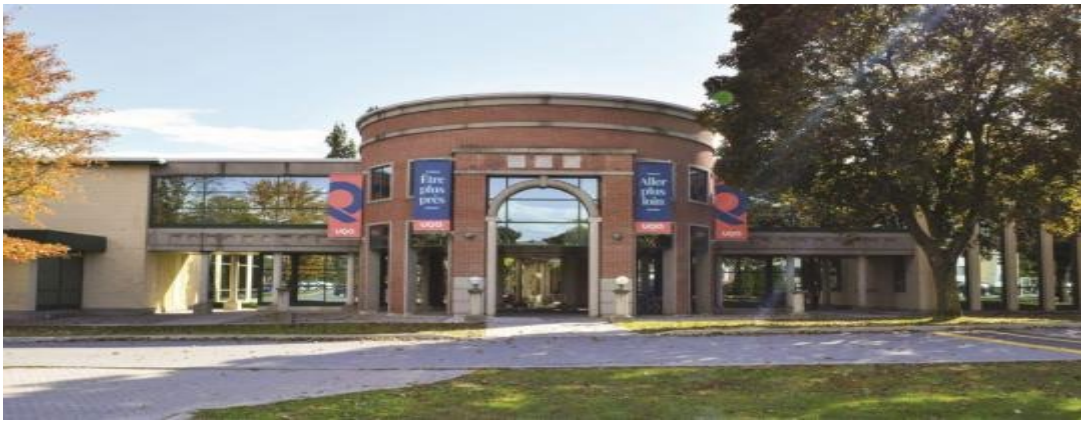
Campus de Gatineau.

Le Département des sciences comptables de l'Université du Québec en Outaouais cherche actuellement à pourvoir deux (2) postes de professeur.es dans le secteur de la comptabilité financière à son campus de Gatineau.