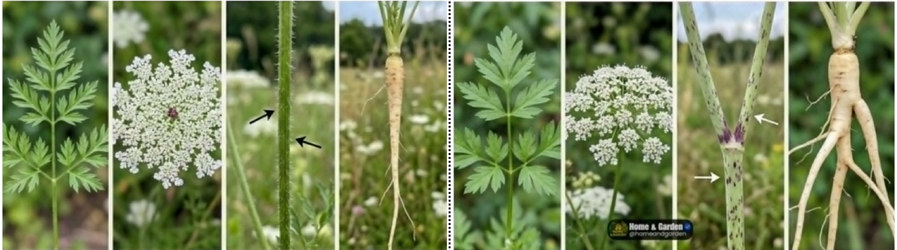
Carotte Sauvage non-toxique