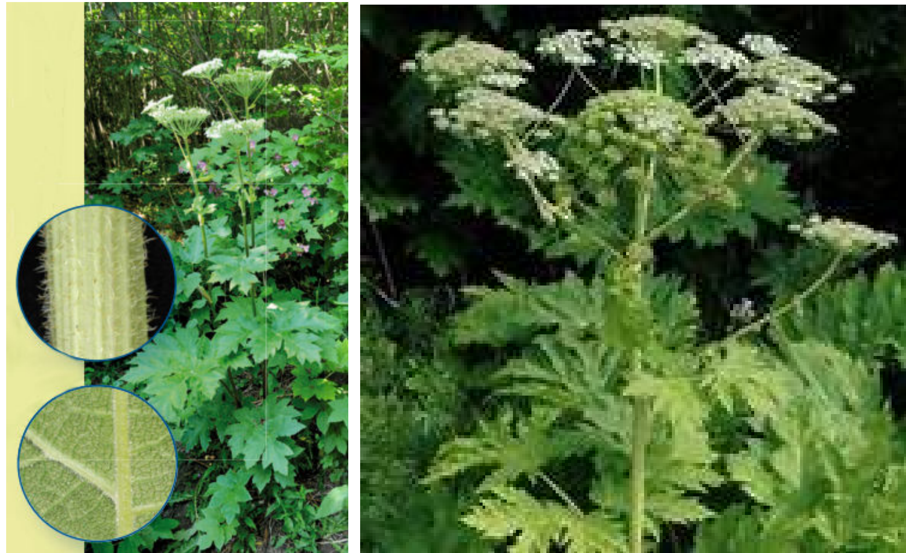
Berce Laineuse non-toxique

Peu ou pas de taches rouges sur la tige et couverte de poils blancs soyeux