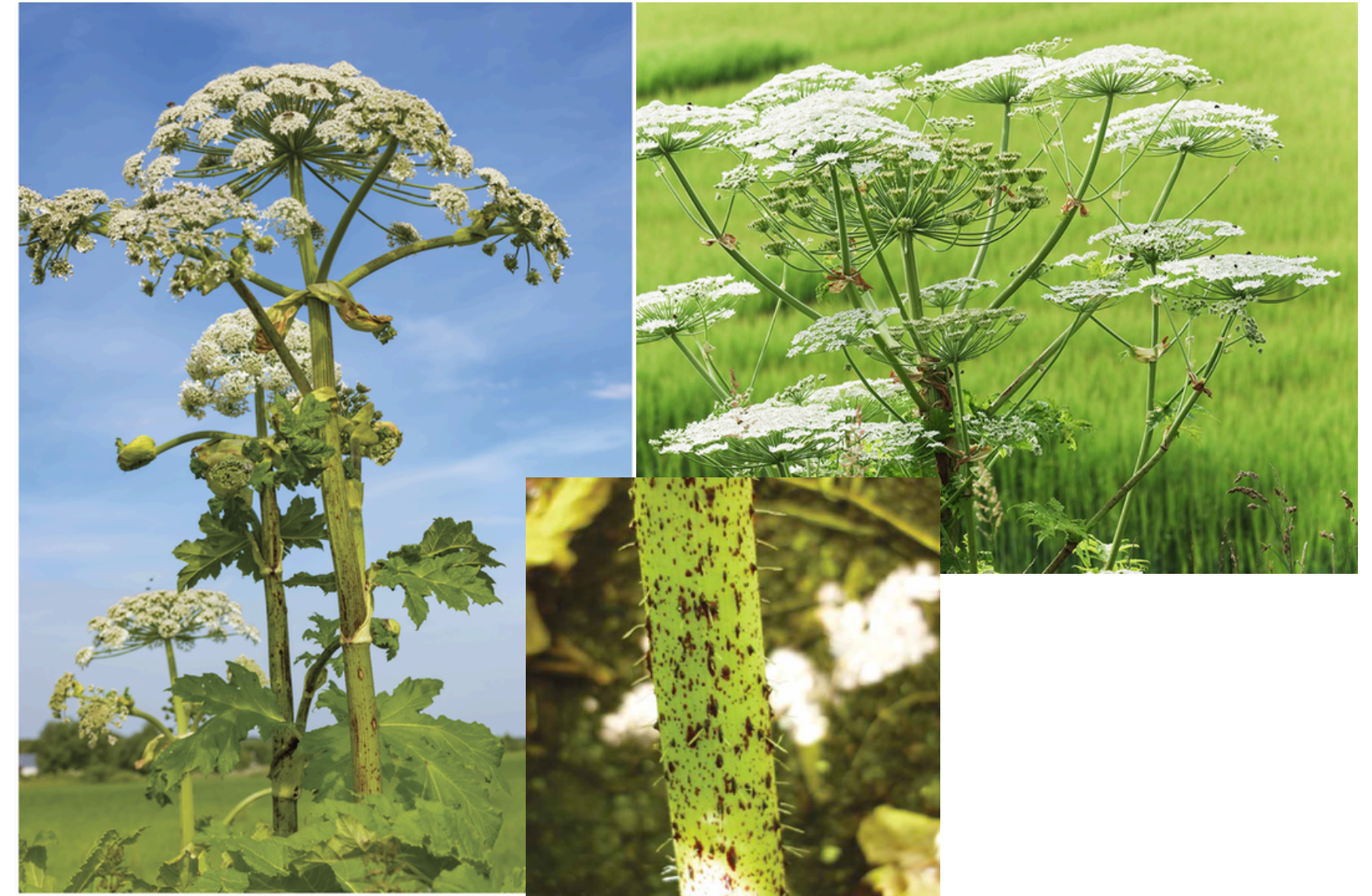
Berce du Caucase Lorsque la sève est activée par la lumière, elle rend la peau extrêmement sensible au soleil (brûlure)

Beaucoup de rouge et peu de poils. Umbelles (regroupement de fleurs) plus larges