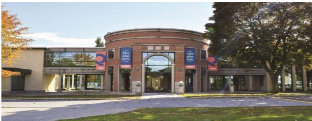
Campus de Gatineau.

Le Département des sciences comptables de l'Université du Québec en Outaouais cherche actuellement à pourvoir deux (2) postes de professeur.es dans le secteur de la comptabilité financière à son campus de Gatineau.